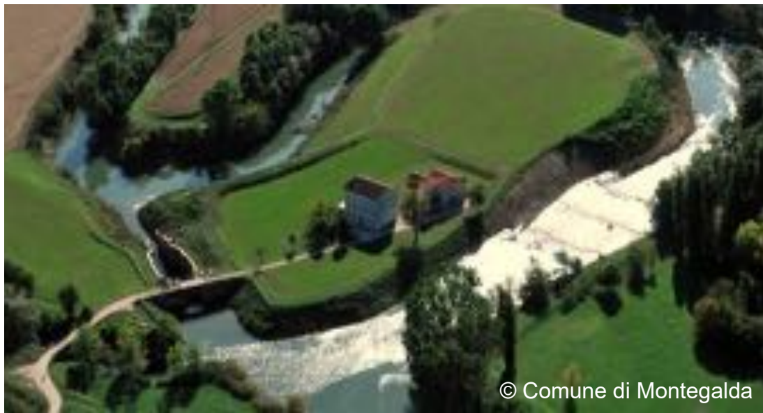
Il casone del Club Amici Pescatori e la conca di navigazione di Colzè

Descrizione: In bici lungo i meandri del fiume Bacchiglione alla conca di navigazione di Colzè nel comune di Montegalda. Lì si trova la casa del Club Amici Pescatori di Montegalda rinchiuso da un'ansa del Bacchiglione. Da loro ci attende un pranzo rustico di pesce fritto (pasta, pesce fritto, dolce). Anche il ritorno si svolge lungo il fiume, cambiando sponda. Passiamo per Cervarese Santa Croce, Montegaldella, Montegalda, Santa Maria di Veggiano, Creola e Selvazzano Dentro (con opzionale sosta gelato, se non siete troppo stanchi).