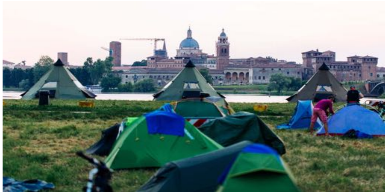
Tende al BAM! 2018 di Mantova

touring bike, MTB, meno adatto a bici di strada