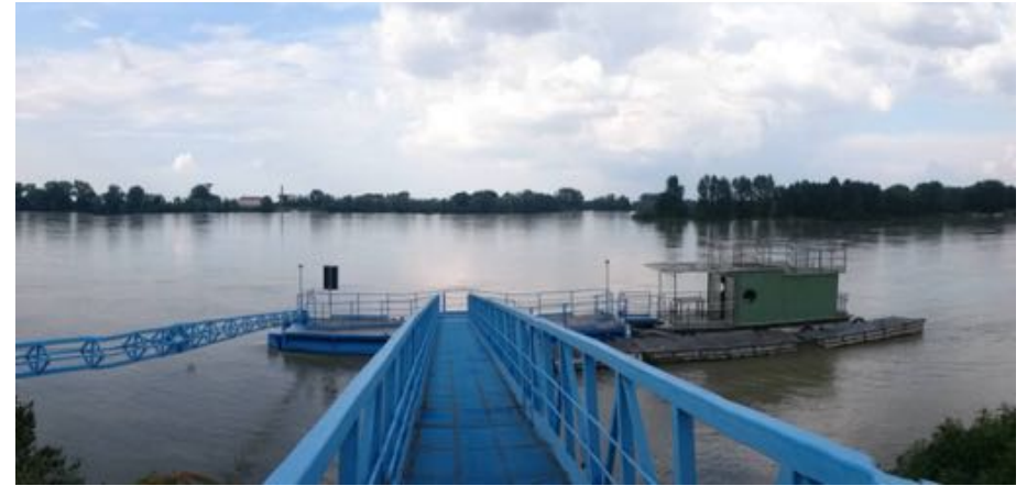
Pre-BAM! a Sermide sul fiume Po