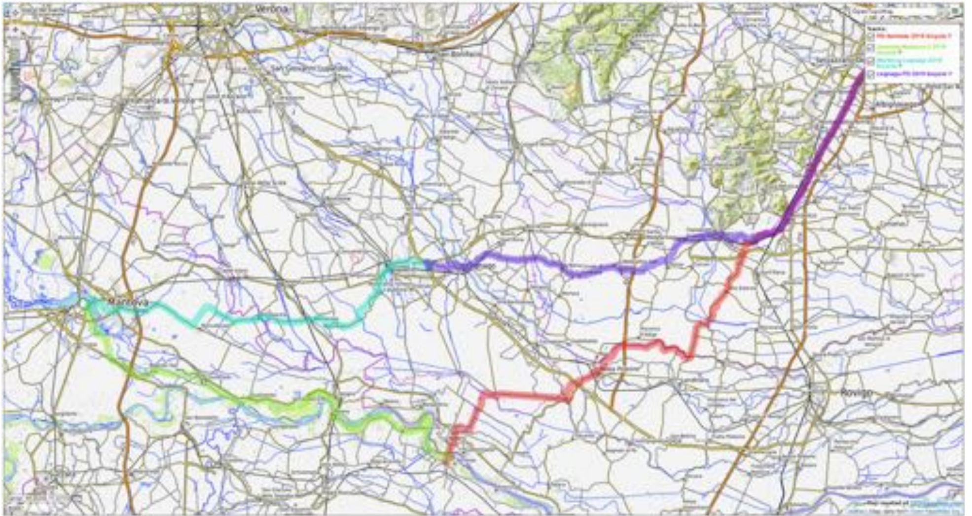
Percorso Padova - BAM2019! Mantova - Padova